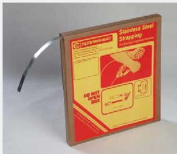
Trake, spojnice i natezači trake