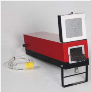
Sušenje elektroda do 300°C -110V