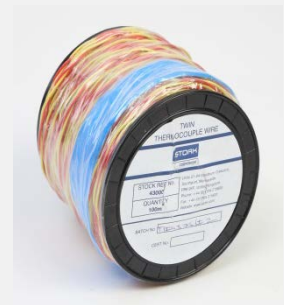
Termo par žica