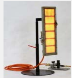
Grejači na gas

Za sva pitanja i zahteve možete nas kontaktirati na office@vecowelding.com ili na tel. 0631669646.