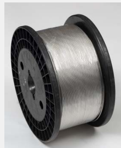
Žica za grejače